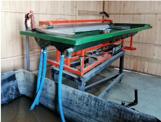
Mesa gravimétrica para recuperación de oro