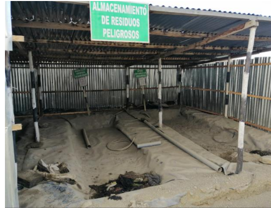
Almacenamiento de residuos peligrosos