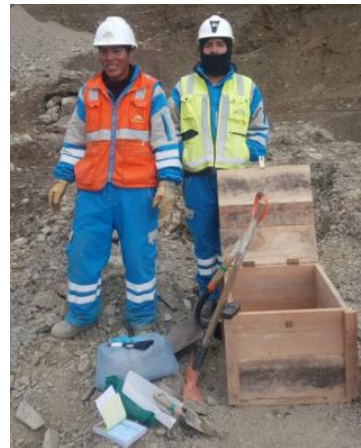
Muestreo de suelo para estudio geomecánico